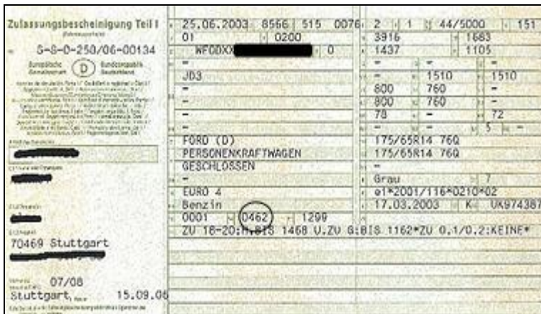
Abbildung 3: „neue“ Fahrzeugscheine - Emissionsschlüsselnummern

Bei neuen Zulassungsbescheinigungen (ausgestellt nach dem 1.Oktober 2005) findet man diese Schlüsselnummer im Feld "14.1". Die letzten beiden Ziffern der 4-stelligen Zahl sind ausschlaggebend.