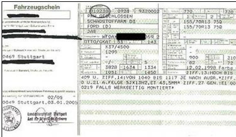
Abbildung 2: „ältere“ Fahrzeugscheine - Emissionsschlüsselnummern

Bei neuen Zulassungsbescheinigungen (ausgestellt nach dem 1.Oktober 2005) findet man diese Schlüsselnummer im Feld "14.1". Die letzten beiden Ziffern der 4-stelligen Zahl sind ausschlaggebend.