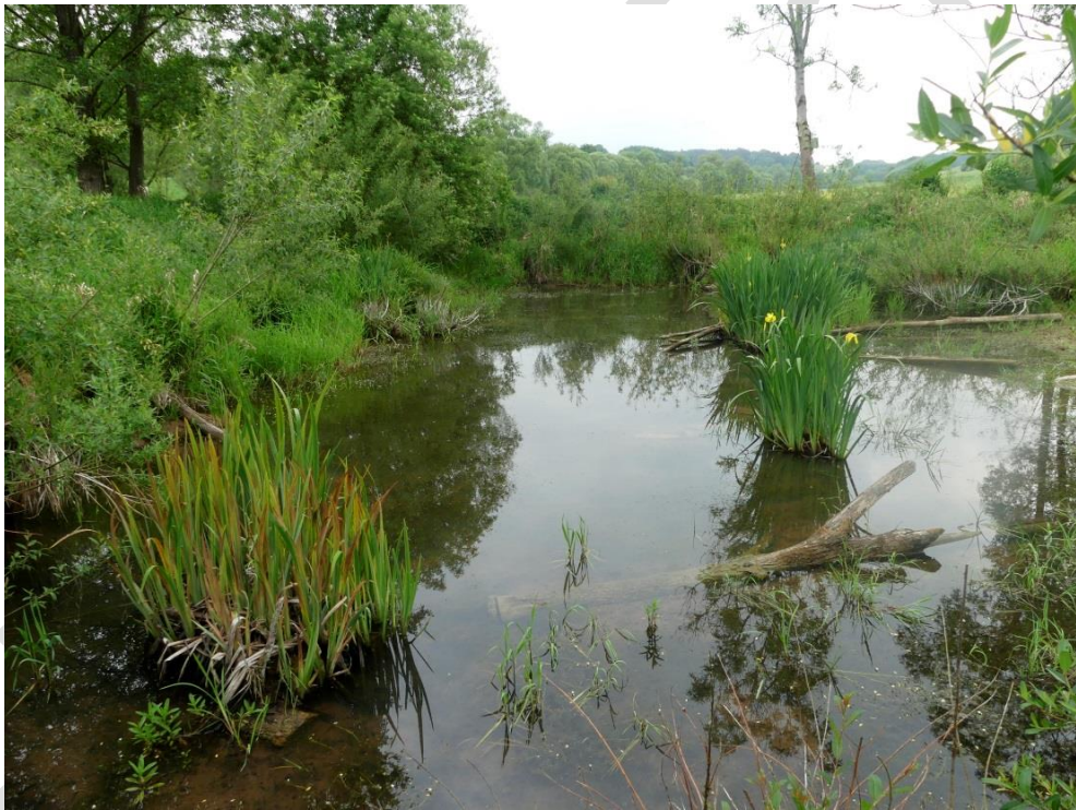
Abb. 22: Potenzielles Kammmolchgewässer östlich von Deining

Im FFH-Gebiet gelangen keine Nachweise des Kammmolchs. Überprüft wurde im Jahr 2018 ein ehemaliger Nachweis in einem Teich östlich von Deining.