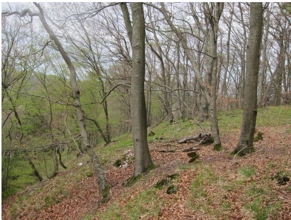
Abb. 14: Orchideen-Buchenwald