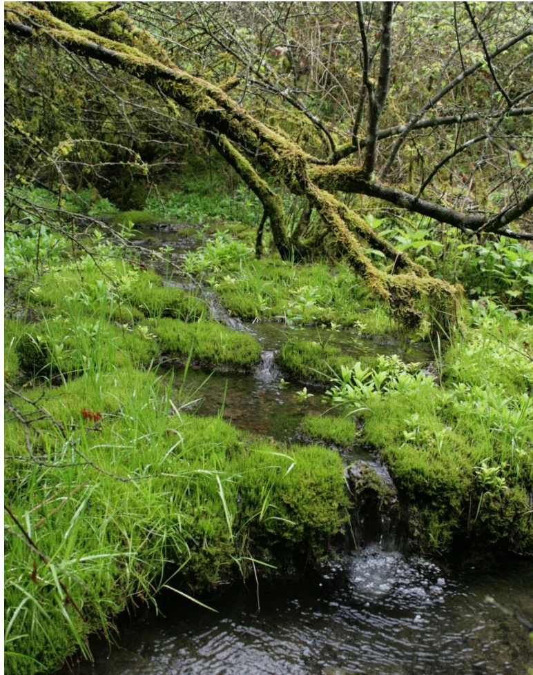
Abb. 8: Kalktuffquelle nahe Wegscheid westlich Holnstein