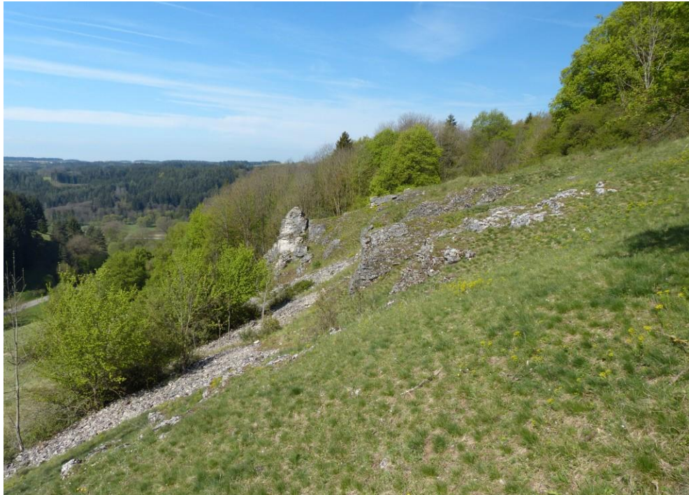
Abb. 4: Lebensraumtypenkomplex aus Kalkpionierasen (60 %), Kalkfelsen (20 %) und Kalkmagerrasen (10 %) (ID 374)