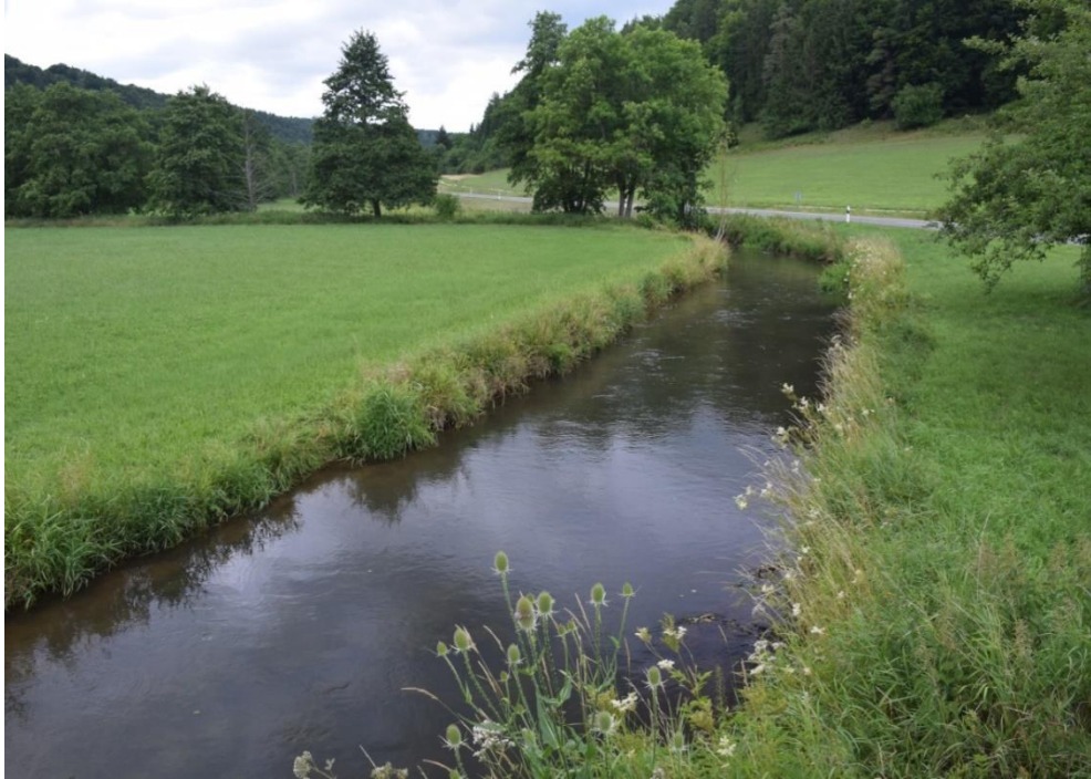
Abb. 31: Unterbürger Laaber bei Unterbürg. Die landwirtschaftliche Nutzung reicht bis unmittelbar an das Gewässer heran. Ein Gewässerrandstreifen und Fischunterstände fehlen.

Das Interstitial (Kieslückensystem) in der Probestrecke ist durch die hohen Sandfrachten durchgehend kolmatiert. Aufgrund der zum Zeitpunkt der Befischung stattfindenden Brückenbaumaßnahmen an der Ritzermühle wurde der gesamte Abfluss der Weißen Laaber über die Ausleitungsstrecke geleitet. Die Sohle im oberen Teil der Ausleitungsstrecke war besonders stark versandet, der Sand stammt sehr wahrscheinlich aus dem oberhalb liegenden Stauraum, welcher durch die Abflussumleitung frei gespült wurde. Im gesamten Befischungsabschnitt fehlen geeignete Unterstände für die Groppe. Größere Steine, unterspülte Baumwurzeln und Totholz sind nur sehr vereinzelt vorhanden. Eine Gewässerbeschattung ist stellenweise gegeben. An der Ritzermühle gibt es eine Fischwanderhilfe, die Durchgängigkeit an diesem Querbauwerk ist gegeben.