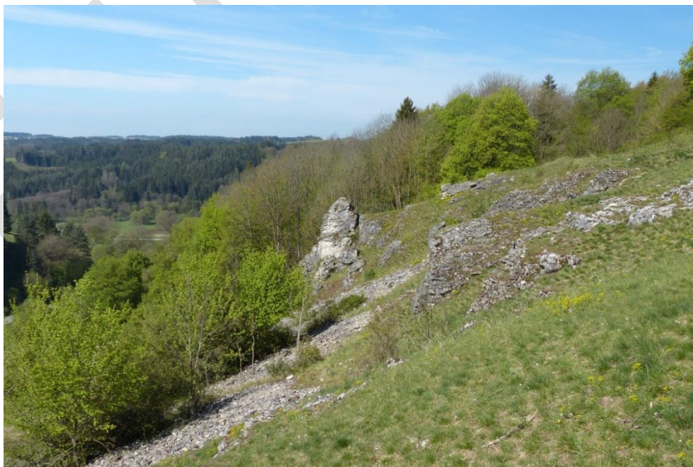
Abb. 11: Kalkfelsen mit Felsspaltenvegetation westlich Mittersthal (ID 374)

Es konnten 34 Flächen des Lebensraumtyps Kalkfelsen mit Felsspaltenvegetation erfasst werden. Ein Drittel der Flächen liegen in Verzahnung mit anderen Lebensraumtypen vor, das übrige Drittel ist häufig mit Kalkmagerrasen (6210) und Kalkpioniergras (6110*) sowie selten mit Kalkschutthalden (8160*) und Kalkmagerrasen mit Orchideen (6210*) vergesellschaftet. Nahezu über das gesamte Gebiet ist dieser Lebensraumtyp zerstreut und bildet Schwerpunkte bei Deining, Holnstein, Dietfurt, Breitenbrunn und Wissing. Isolierte Einzelflächen befinden sich bei Leutenbach und Waltersberg.