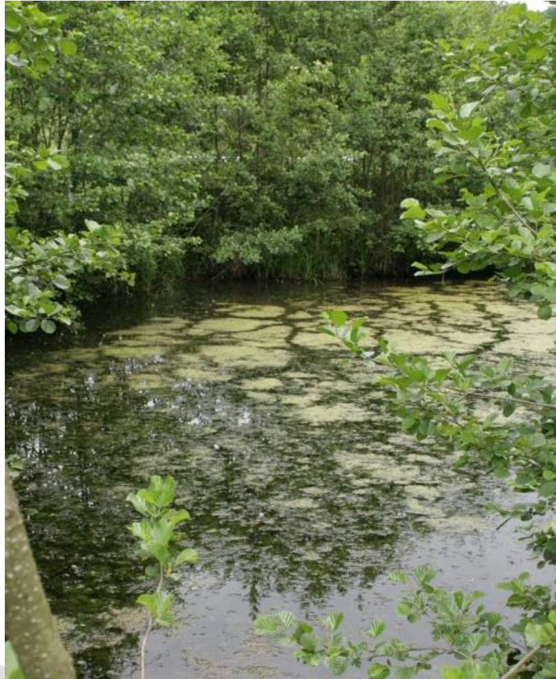
Abb. 17: Nährstoffreiches Stillgewässer bei Holnstein

Die erfassten sieben Flächen des Lebensraumtyps befinden sich sehr zerstreut zwischen St. Helena und Holnstein im Tal der Weiße Laaber. Insgesamt liegen alle Flächen im Komplex mit anderen Biotopen vor, nicht aber in Komplex mit anderen Lebensraumtypen.