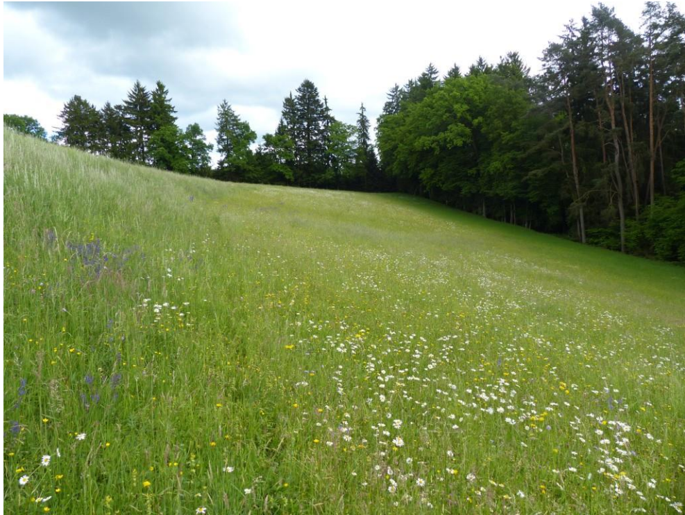
Abb. 7: Magere Flachland-Mähwiese bei Thannbühl (ID 278) (Bild: A. Rudolph).