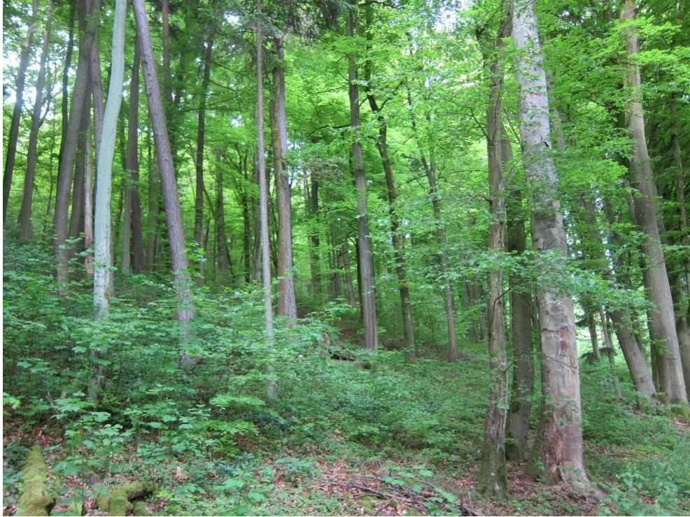
Abb. 13: Waldmeister-Buchenwald

Im FFH-Gebiet nimmt dieser Lebensraumtyp mit etwa 95 ha knapp 11 % der Waldfläche ein und kommt in zwei Ausprägungen vor: