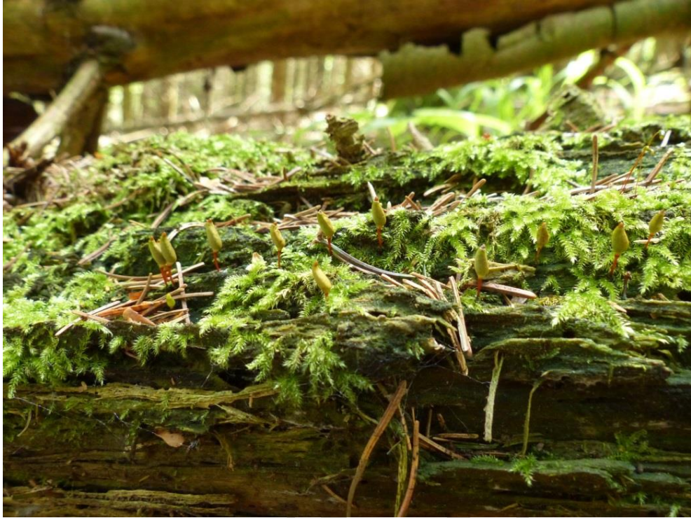
Abb. 30: Sporophyten des Grünen Koboldmooses auf liegendem Fichtentotholz im Gewann „Gestaudenholz“ südlich von Holnstein