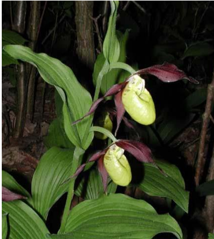
Abb. 26: Frauenschuh ( Cypripedium calceolus )