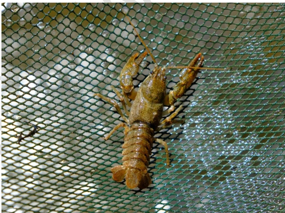
Abb. 27: Nachweis eines Steinkrebsses ( Austropotamobius torrentium) in der Unterbürger Laaber bei der Ritzermühle im Juli 2017