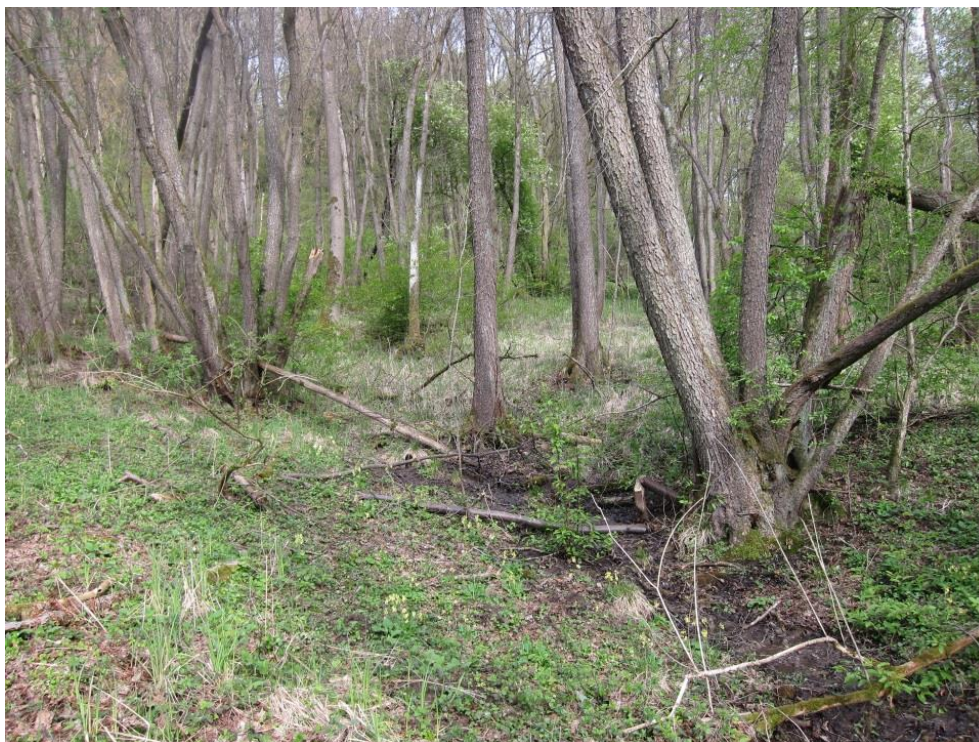
Abb. 16: Schwarzerlen-Eschen-Sumpfwald