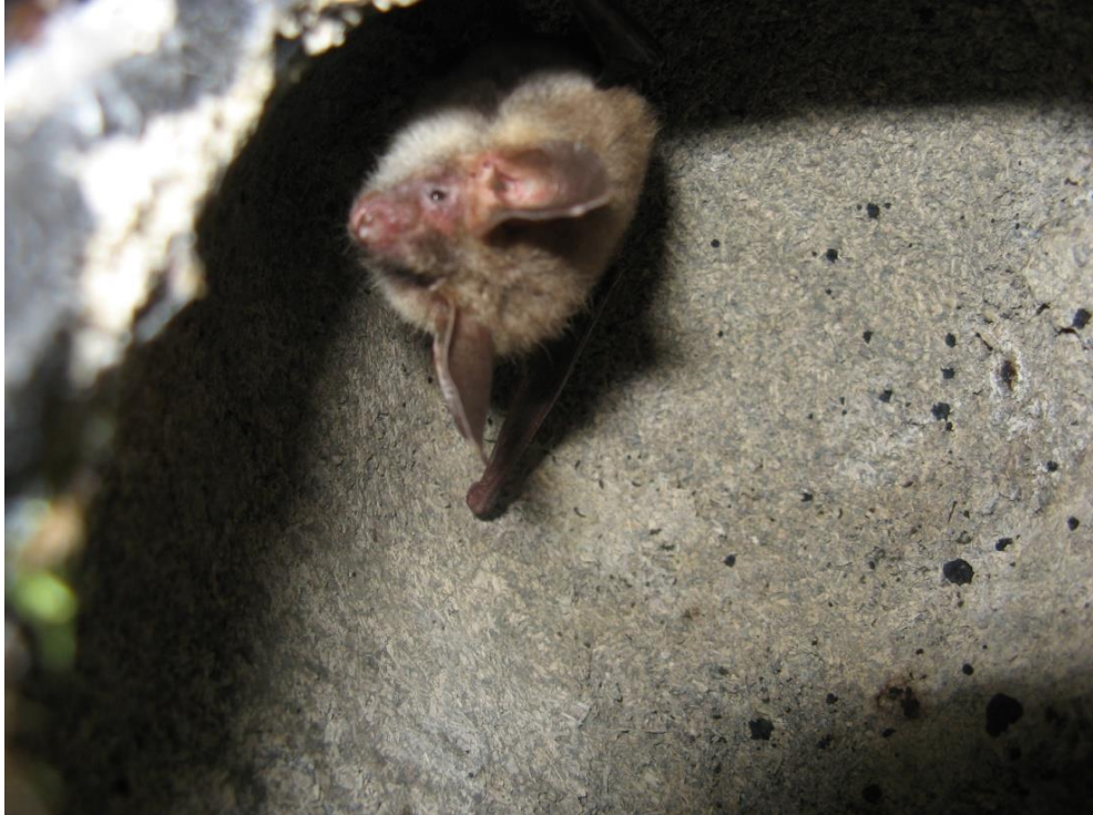
Abb. 23: Bechsteinfledermaus ( Myotis bechsteinii )

gen im Osten des Gebiets in einer Entfernung zwischen 20 km und 30 km in den FFH-Gebieten 6736-301 „Schloßberg, Wolfgangshöhle und Hohllochberggruppe bei Velburg“ und 6736-302 „Truppenübungsplatz Hohenfels“.