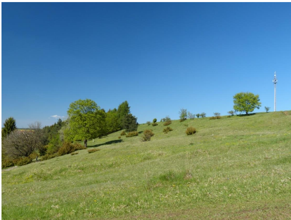
Abb. 5: Kalkmagerrasen östlich von Deining (ID 320)