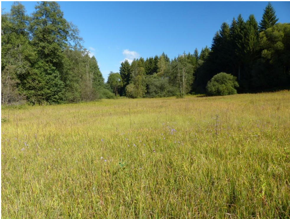
Abb. 9: Kalkreiches Niedermoor nördlich der Laabermühle südlich von Deining (ID 388)

Dieser Lebensraum ist ausschließlich im Tal der Weiße Laaber zwischen St. Helena und Staadorf eingestreut, wobei ein Schwerpunkt im Lengenbachtal liegt.