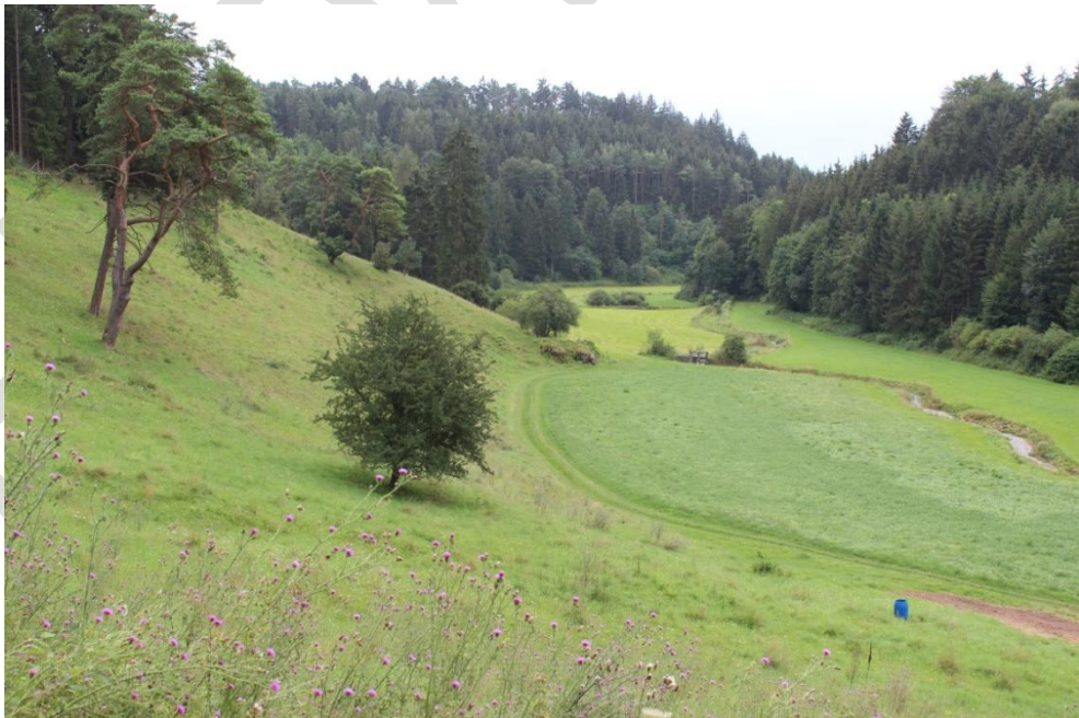
Abb. 1: Breitenbrunner Laaber bei Breitenbrunn

Naturräumlich ist das Gebiet den Haupteinheiten „Südliche Frankenalb“ und „Mittlere Frankenalb“ in den Untereinheiten „Hochfläche der Südlichen und Mittleren Frankenalb“ und „Altmühltal“ zuzuordnen.