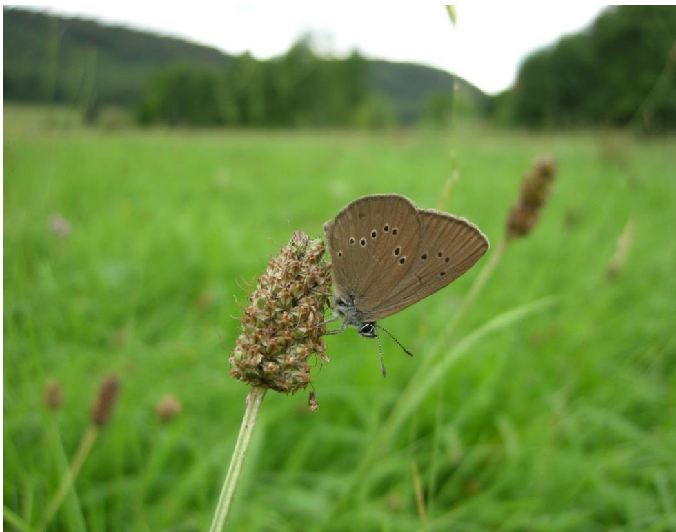
Abb. 21: Nachweis des Dunklen Wiesenknopf-Ameisenbläulings im Laabertal zwischen St. Bartlmä und Untermühle