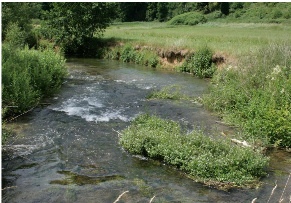
Abb. 2: Fließgewässer mit flutender Wasservegetation südlich von Breitenbrunn (ID 141)