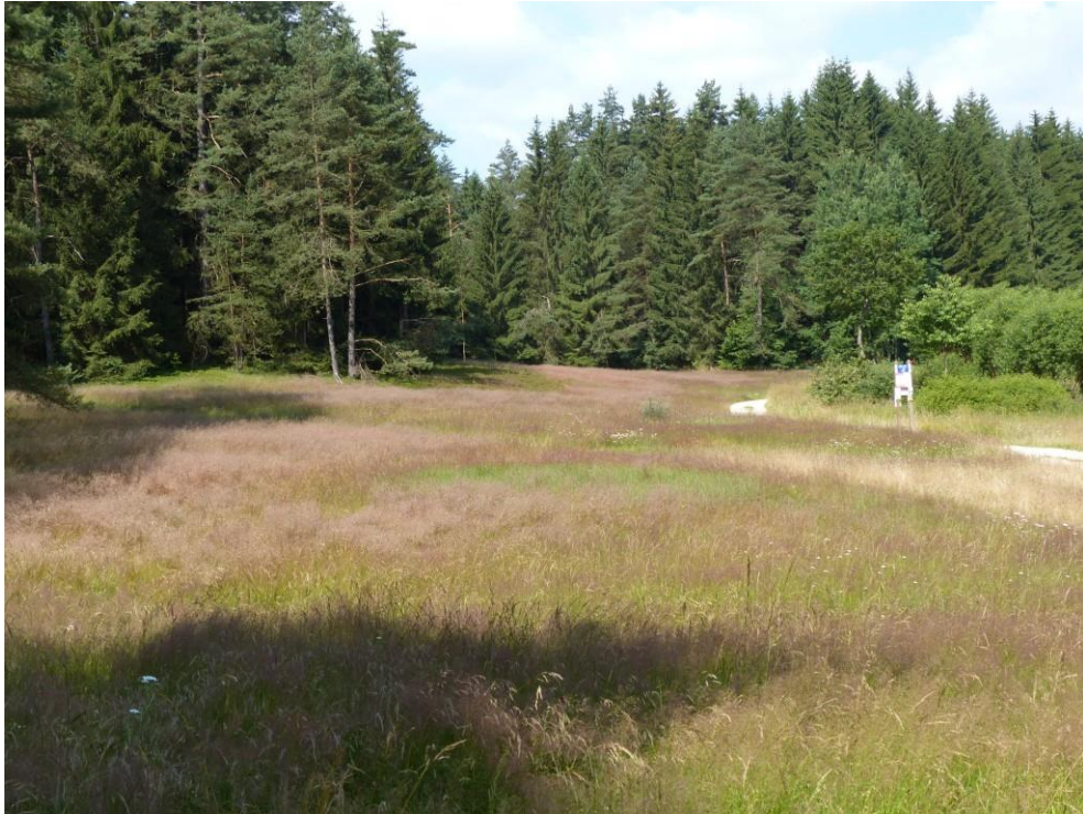
Abb. 18: Trockene Heide im Lengenbachtal (ID 234)