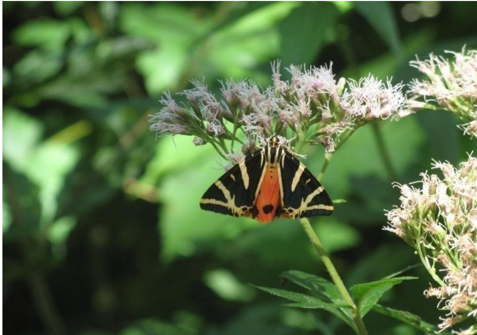
Abb. 28: Spanische Flagge ( Euplagia quadripunctaria )

In fast allen Teilflächen des FFH-Gebietes sind ausreichend Habitate für die Larven und Falter der Spanischen Flagge vorhanden. Vor allem geeignete Hochstaudenfluren entlang von Bächen und Forststraßen sowie walddnahe Hecken und Magerrasenbrachen sind als Lebensraum hervorragend geeignet. Beeinträchtigungen wie z. B. Mahd oder Mulchen der Wegränder in den Sommermonaten wurden nur vereinzelt festgestellt.