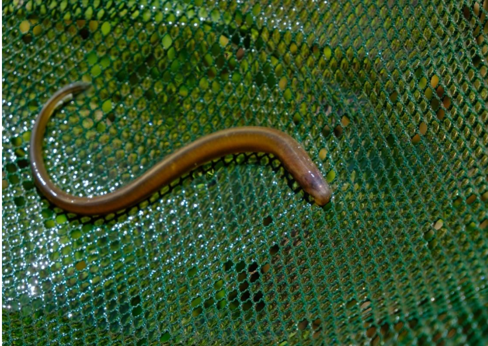
Abb. 29: Nachweis eines Bachneunaugenquerders ( Lampetra planeri ) in der Weißen Laaber bei Haas im Juli 2017