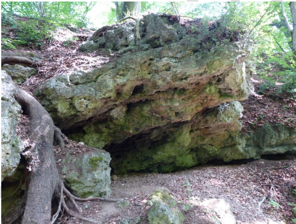
Abb. 12: Höhle nordöstlich von Holnstein

Geodaten und Beschreibungen der Höhlen wurden freundlich vom Landesverband für Höhlen- und Karstforschung Bayern e. V zur Verfügung gestellt. Es wurde ein Stillschweigen über die Daten in der Öffentlichkeit vereinbart.