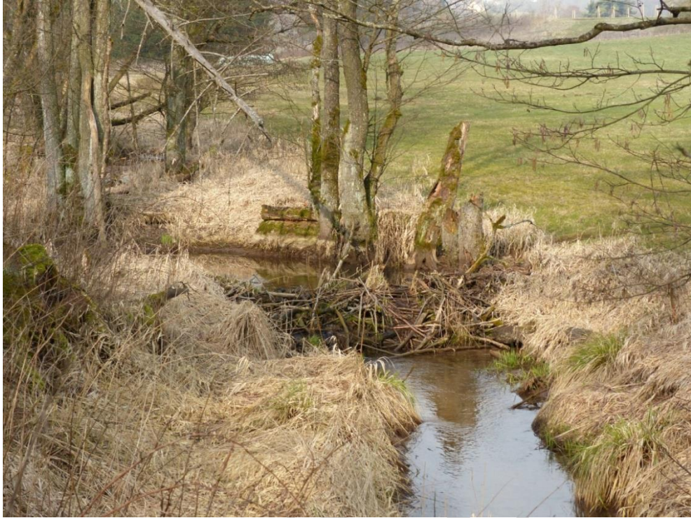
Abb. 25: Biberdamm westlich von Deining im Schwalgraben