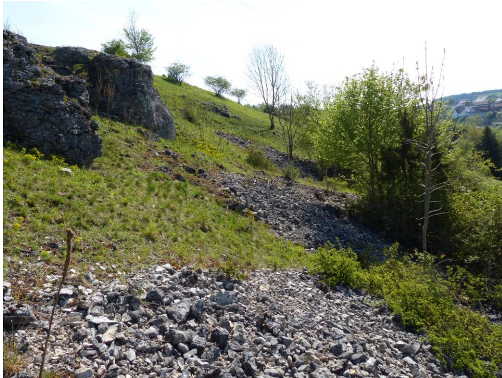
Abb. 10: Kalkschutthalde westlich Mittersthal (ID 374)