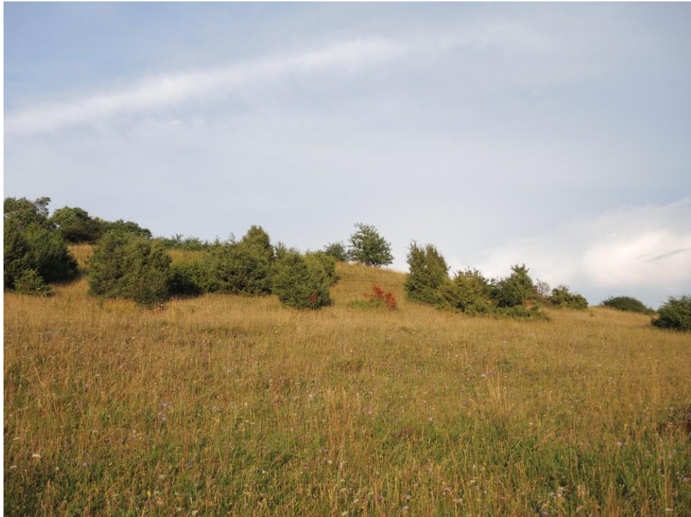
Abb. 3: Wacholderheiden nordwestlich von Wissing (ID 63)