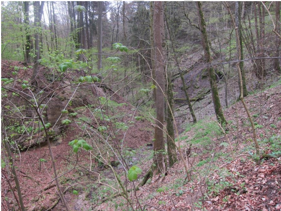
Abb. 15: Schlucht- und Hangmischwald

An typischen Pflanzen der Bodenvegetation sind Stinkender Storchschnabel ( Geranium robertianum ), Christophskraut ( Actaea spicata ), Aronstab ( Arum maculatum ), Stachelbeere ( Ribes uva-crispa ) und auch seltenere Arten wie z. B. Gelber Eisenhut ( Aconitum lycoctonum ) und Märzenbecher ( Leucojum vernum ) anzutreffen.