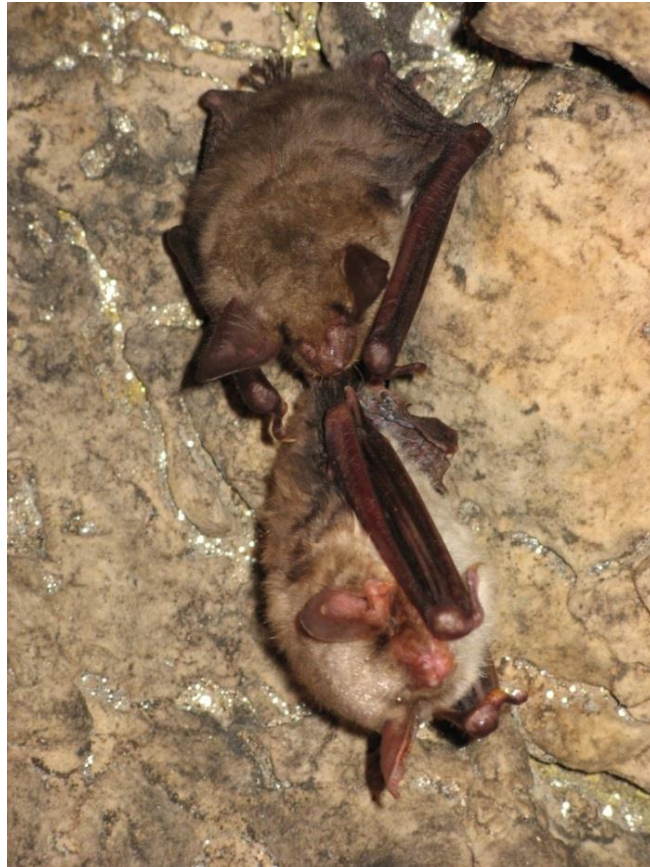
Abb. 24: Zwei Große Mausohren ( Myotis myotis )