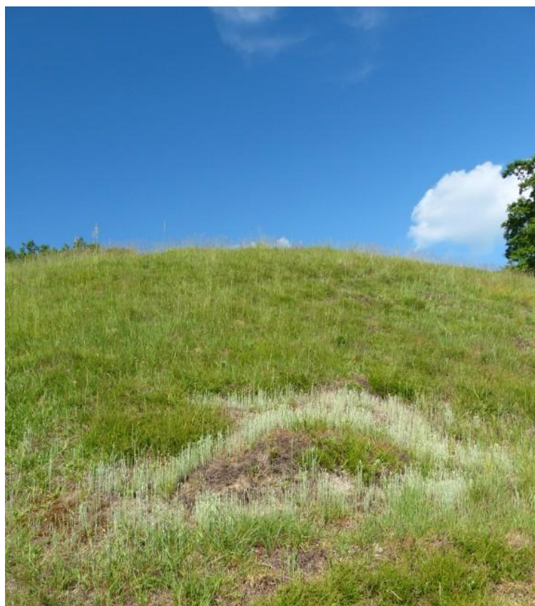
Abb. 19: Artenreiche Borstgrasrasen nordwestlich der Laabermühle (ID 403)