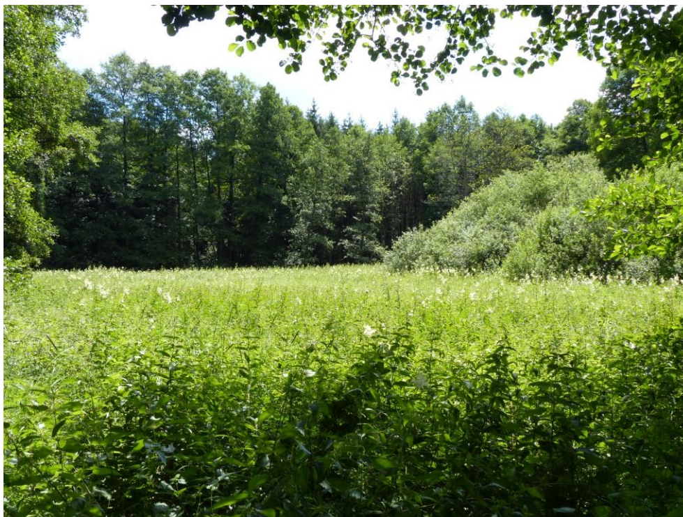
Abb. 6: Hochstaudenflur im Tal der Unterbürger Laaber (ID 257)